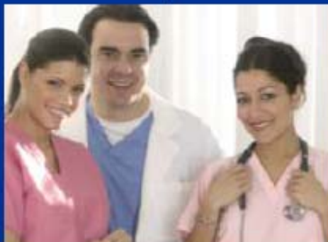
Les autres professionnels de santé