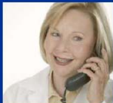
Le médecin scolaire, le RASED