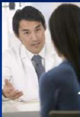
Le médecin traitant