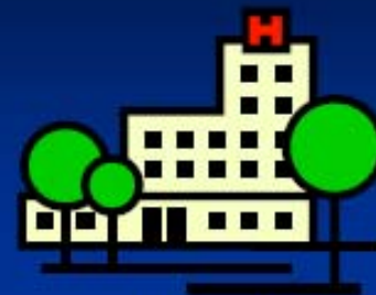
Le centre référent pour les troubles d'apprentissage