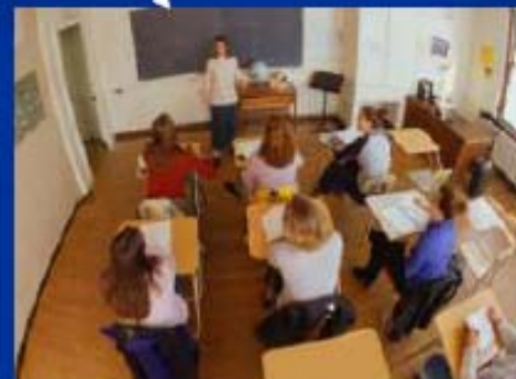
L'enseignant de l'enfant, l'équipe éducative